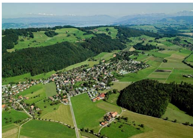
Flugaufnahme Hausen am Albis